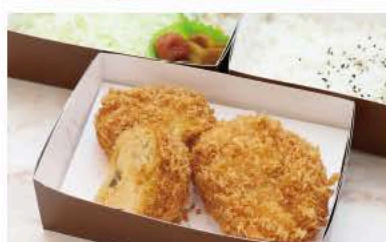
かにクリーム コロッケ弁当