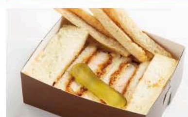
むら八かつサンド