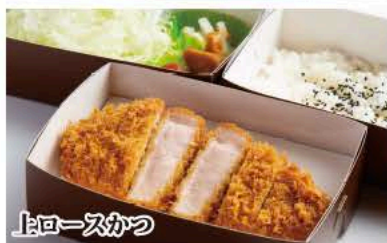
上ローズかつ弁当 (150g)