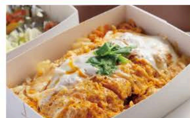
昭和のかつ丼弁当