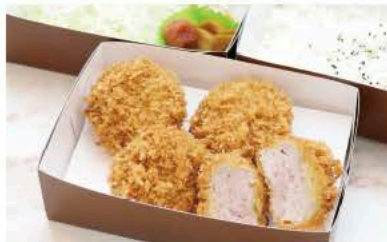
ヒレかつ (30g×4ヶ) 弁当