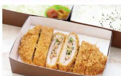
スタミナかつ弁当