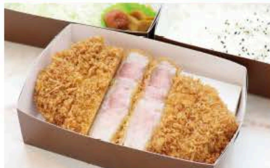
ジャンボローズかつ 弁当 (250g)