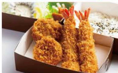
海老ヒレかつ弁当